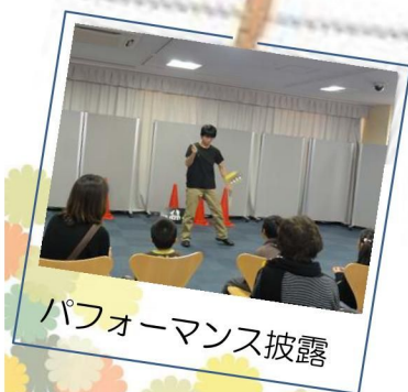
パフォーマンス披露