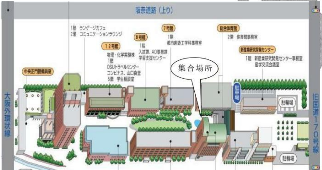
大阪産業大学キャンパスマップ