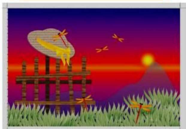
※この画像を作成します。