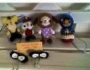
B MLK COODA (みるく こお)