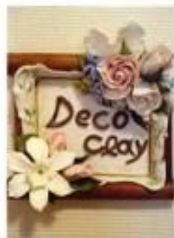
C DECOクレイクラフト大東教室