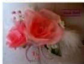
J hana field