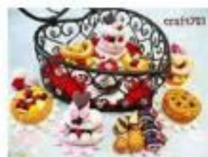
G Craft☆703 とろけだち