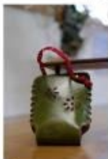
L チューリップハウス