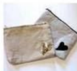
M epingle 田中 美代子