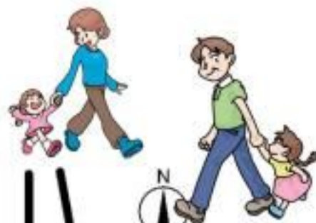
配置図（4階 多目的室）