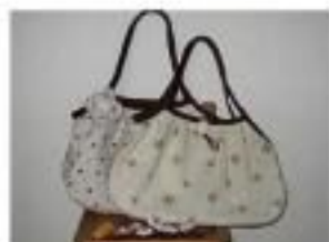
N petit couture