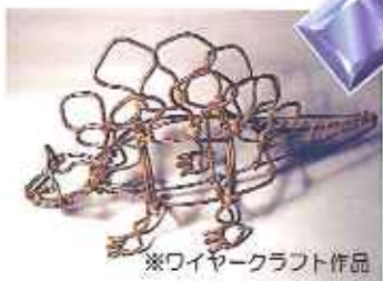
※ワイヤークラフト作品

ワイヤークラフト、ビーズ、あみぐるみ、粘土クラフト、 手芸作品などの展示、販売、制作体験コーナー。