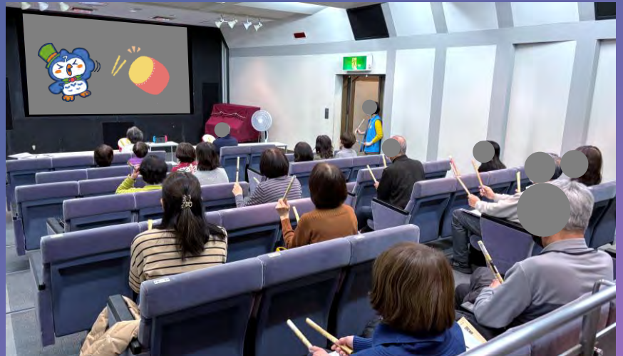
※令和6年度にDIC21で実施したeスポーツイベントの様子

様々なジャンルのゲームがあり、多様性の促進、雇用機会の創出、地域活性化、そして現代に求められるスキル、オンラインコミュニケーション能力の育成といった面でも期待されています。