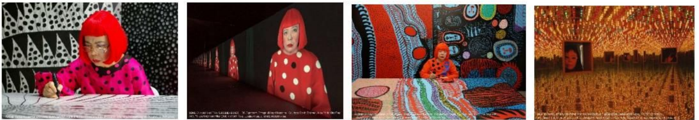
Artist Yayoi Kusama drawing in KUSAMA -INFINITY.

60年以上にわたる芸術活動の中で、独自の芸術を表現し続け、世界で最も有名な芸術家の1人となった草間彌生氏。第2次世界大戦下の日本で暮らした過去、芸術への情熱を理解されなかった家庭環境、芸術界における人種差別や性差別、自身の病など、数々の困難を乗り越えながら、絵画、彫刻、インスタレーション、パフォーマンスアート、詩や文学と様々な分野で輝かしい功績を残し、今もなお創作活動に全てを捧げる人生を送る彼女。幼少期からアメリカへ単身で渡るまで、そしてニューヨーク時代に苦悩しながら行った創作活動と、当時それらの作品が国内外でどのように評価されたのか、知られざる過去を捉える。本ドキュメンタリーでは、世界中の人々から人気を博す彼女の作品が果たしてどのような想いで、どのようにして制作されてきたのかが描かれる。(77分)