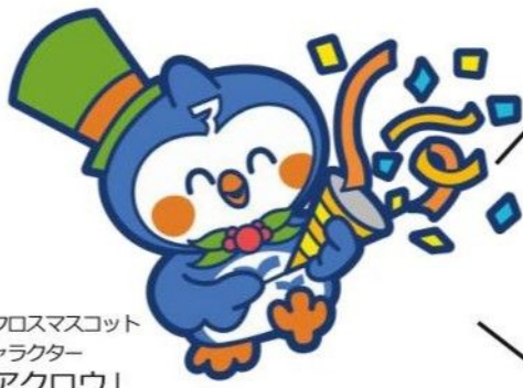
アクロスマスコット キャラクター 「アクロウ」