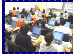
アクロス主催 「ゆっくりパソコン入門」 の様子