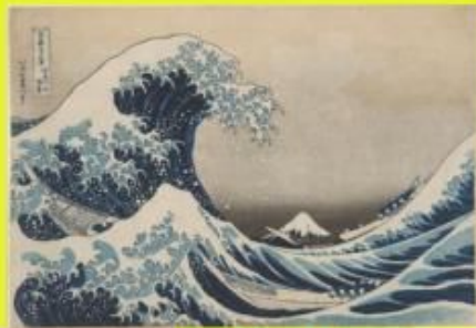
富嶽三十六景 神奈川沖浪裏 天保元(4年1830) 三浦大英博物館蔵