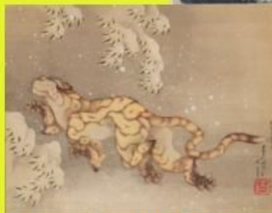
「雪中虎図」嘉永2年(1849/個人)