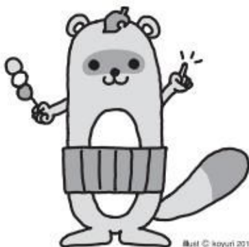
だいたうのええもんキャラクター “トメヤん”

あなたの誇れるまちの”宝”を教えてください。 まちの”宝”でもある ”ええもん” ”ええとこ” を 「だいたうのええもん」として取り上げてPRし ています。「人」「製品」「食べ物」「イベント」 「団体」「歴史」「風景」「企業」「活動」「店」 「生き物」など、大東市のまちに関係するも の・ことであればジャンルは問いません。