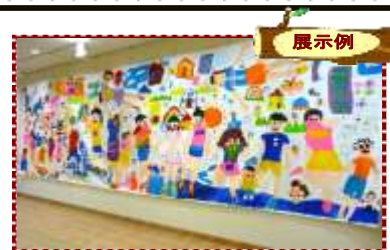
キッズウォールアート (平成22年7月開催)