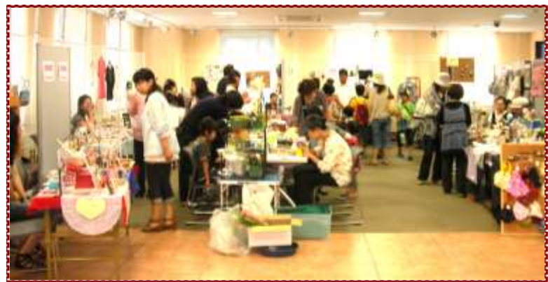
アクロスクラフトギャラリー展 (平成23年7月開催)