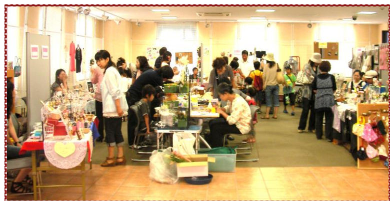
アクロスクラフトギャラリー展 (平成23年7月開催)