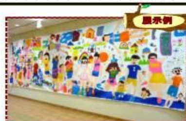
キッズウォールアート