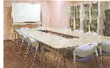
男女共同参画ルーム

② 多目的室での楽器演奏およびマイク等音響機器の使用についてはAB全面使用の場合のみとなります。